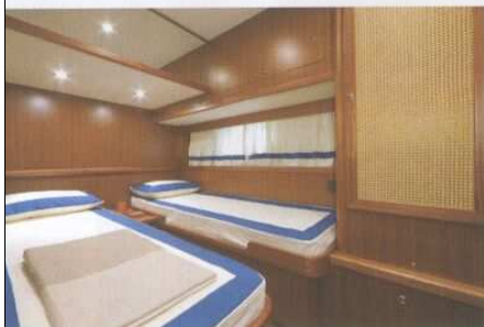
A sinistra, la cabina ospiti di poppa, con i letti gemelli. In alto, la Vip di prua, con il letto matrimoniale. A destra, i layout dei due ponti su cui è articolata la barca e quello del flying bridge, la grande novità.

scafo. Grazie alla sua geometria decisamente pronunciata, si integra infatti perfettamente con le linee dello scafo, esaltando la forma tonda tipica di queste imbarcazioni e sottolineando la bella plancia balneare, anch'essa in teak, che rende estremamente vivibile questa barca e la caratterizza fortemente, regalando linee insolite, ma perfettamente calibrate con il resto della struttura. Gli interni, firmati com'è consuetudine da qualche tempo per le barche di Apreamare dallo studio di progettazione Victory Design di Brunello Acampora, riprendono quelli del celebrato 60 piedi. Tre le cabine doppie: la suite armatoriale full beam a centro barca, che ha un bagno con finestra panoramica e un grande guardaroba; la Vip, a prua, che dispone di doccia extralarge e grandi armadi, e infine la doppia tradizionale, a poppa, anch'essa dotata di bagno privato. Ancora più a poppa, dietro la sala macchine, c'è la cabina equipaggio, con l'ingresso separato. Lo stile è classico ed elegante, caratterizzato da tessuti nei classici colori bianco e blu; dall'essenza di mogano usato lucido e opaco in studiata alternanza e dagli inserti in paglia di Vienna, un particolare insolito su uno yacht. Attualizzano il tutto i dettagli in acciaio cromato a specchio. L'Apreamare 64 fly monta di serie due Man da 1100 hp che lo spingono fino a una velocità massima di 33 nodi, gli permettono di navigare con un'andatura di crociera di 28 nodi e mezzo e gli assicurano un'autonomia di 300 miglia nautiche.