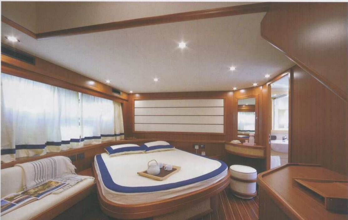
Above: the Apreamare 64 fly under way; opposite page, bottom: a detail of the aft relaxation area. Right, top: the main deck saloon; right: the owner's full beam suite with bathroom and a large panoramic window.