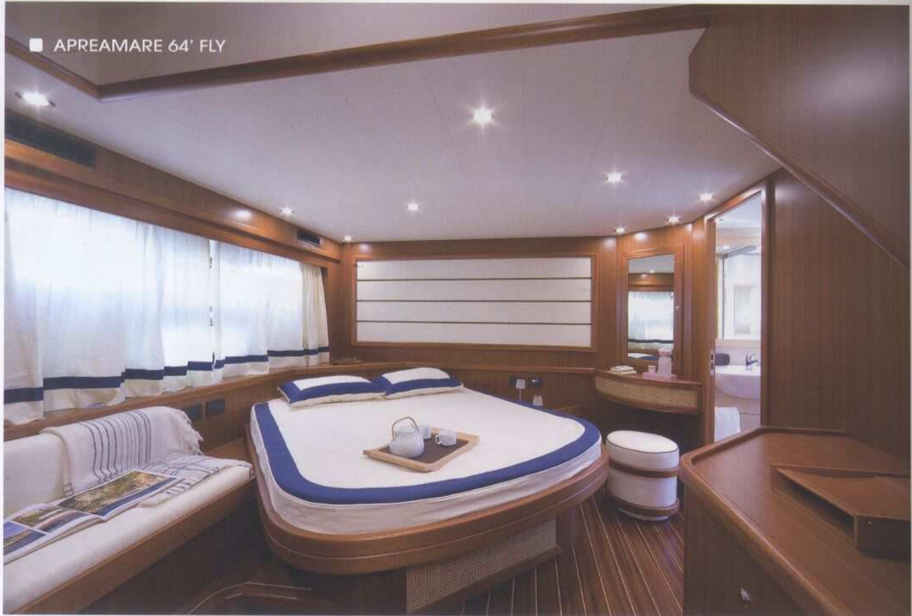
■ APREAMARE 64' FLY

After having won international fame due to the ability to reinterpret and realize the classic Sorrentine fishing boat, transforming it into a very enjoyable and impressive sporting craft both aesthetically and recreationally, the celebrated shipmaker Apreamare has shown its ability to renew itself once again, offering a new Maestro line and a beautiful fly-bridge model, both new contributions to the Italian nautical style. The new Apreamare 64' Fly is a twenty meter craft that revisits the classic Sorrentine fishing boat, enhancing for the very first time into a flybridge, with the objective which was clearly reached of uniting once again the outline and philosophy with respect of traditions. "Until this year," recounts Cataldo Aprea, "I would