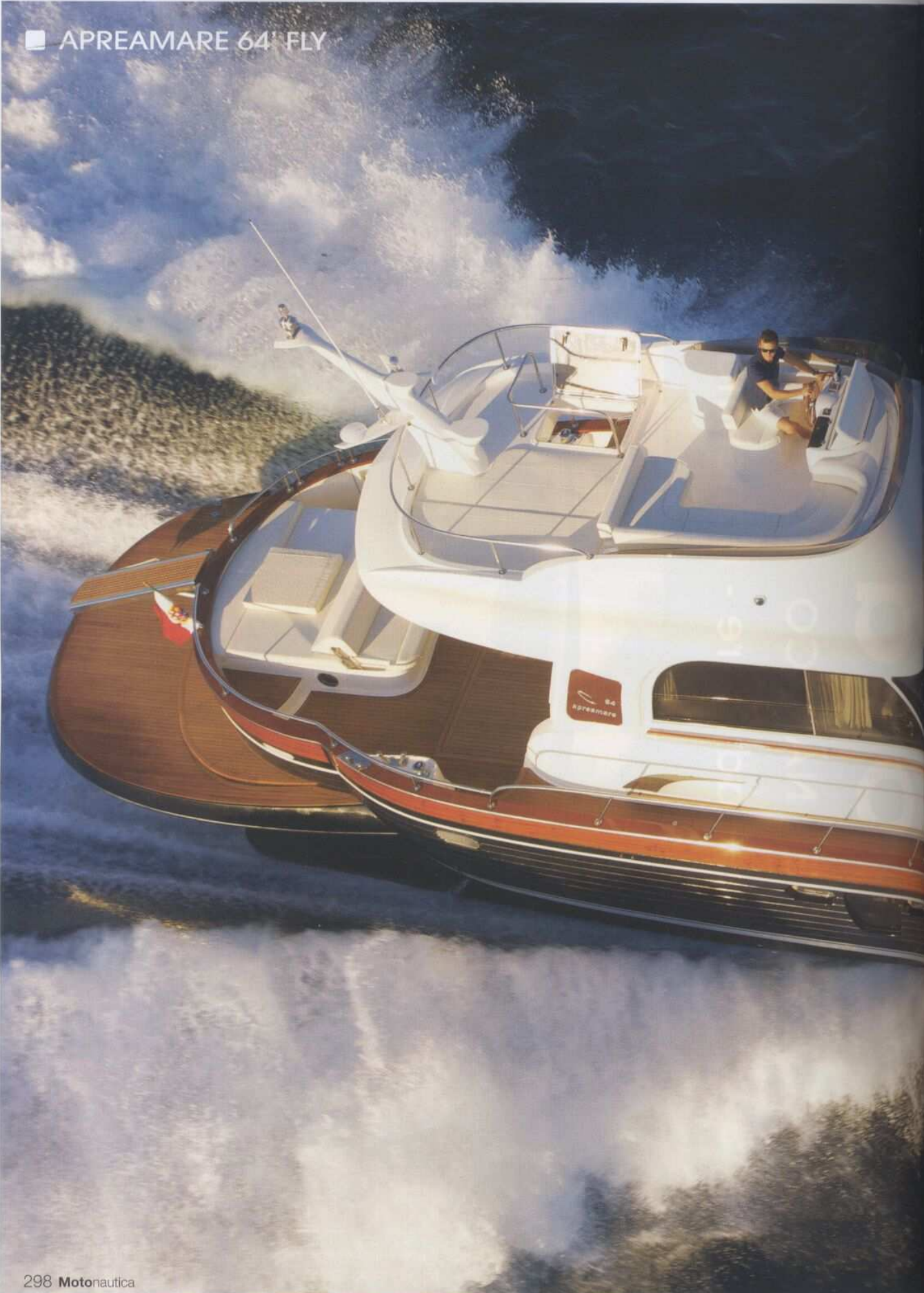
■ APREAMARE 64' FLY